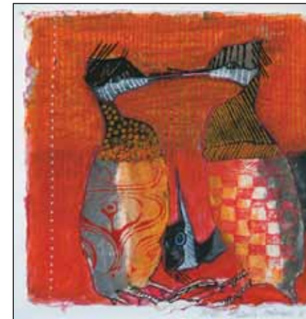
Bodil Helmer Tobiasen