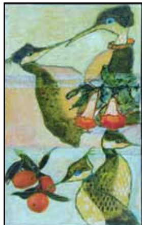
”Lappedykkere til havseselskabet” titel på alle illustrationer.