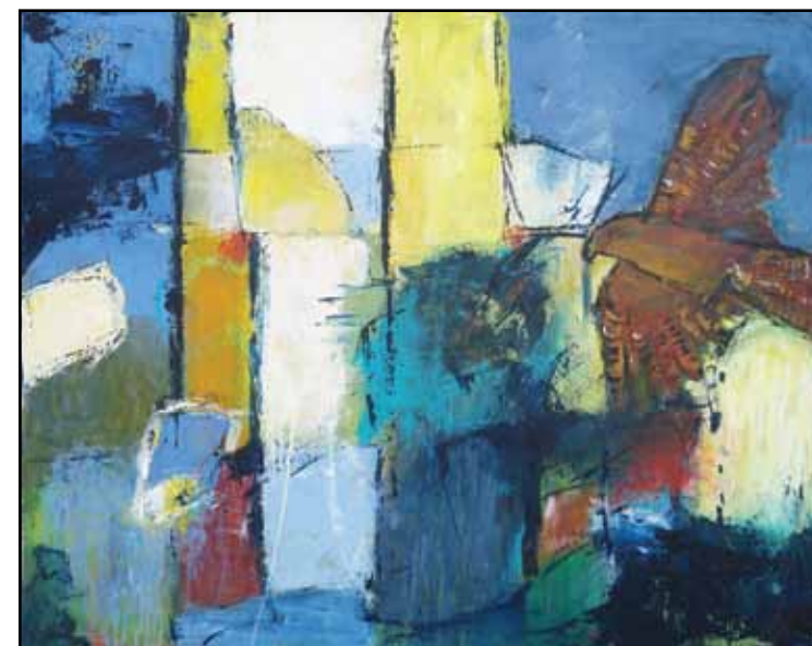
"Rovfugl på jagt"