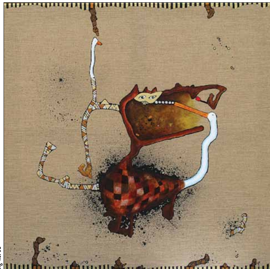
Big no. 52