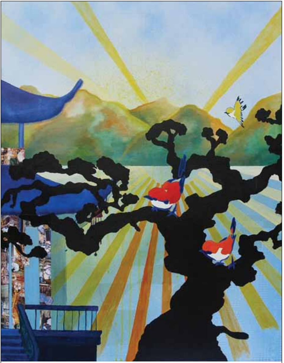
Pia Daae: Nattergalen