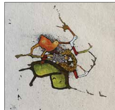
Big no. 45