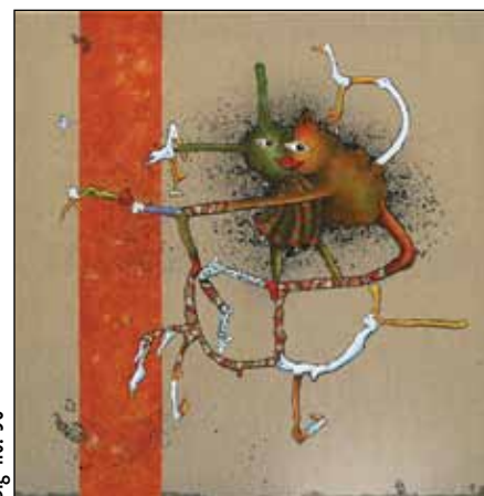
Big no. 58