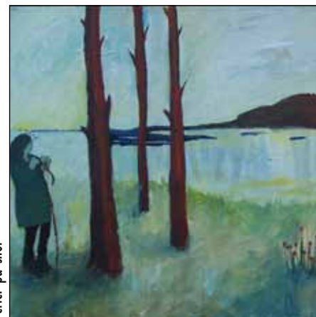
Perler på snor