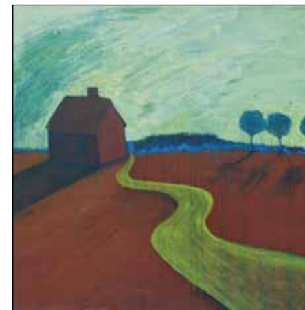
Den gule vej