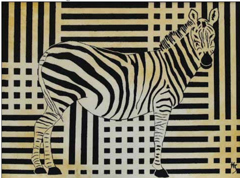
Helle Søberg: Striber

Hvad kan man så snakke med dem om? Det afhænger selvfølgelig dels af børnene og deres alder, dels af billederne. Men nedenfor vil jeg gerne pege på nogle emner, spørgsmål og temaer der kunne være relevante.