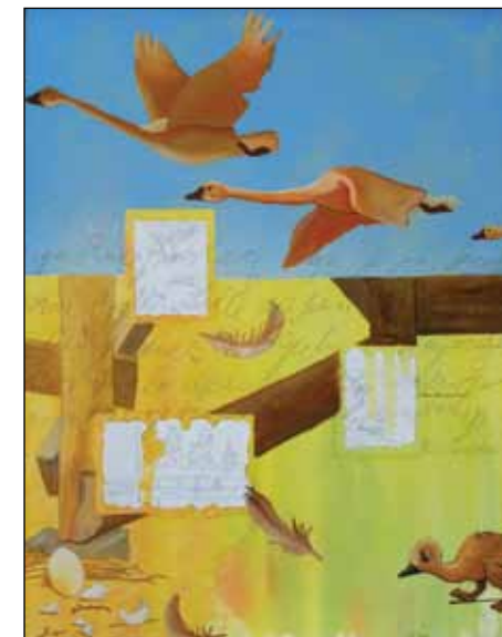
Pia Daae: Den grimme ælling

Hvordan er der arbejdet med farver? Er farverne kraftige, rene eller mere afdæmpede? Er der hovedsageligt arbejdet i én farvefamilie eller når man i højere grad farvepaletten rundt? Hvordan med kontrastforhold – arbejdes der med små eller voldsomme kontraster? lys – mørke kontraster? simultankontraster kvantitetskontraster m.fl. – er der meget brug af brækkede farver, eller bruges farverne rene? Er farverne naturalistiske, fantasiagtige, ekspresionistiske, kolde eller varme? og er der tegn på at der er brugt farvepsykologi og farvesymbolik? Er der i det hele taget farver i sort, gråt og hvidt hvad indflydelse har det?