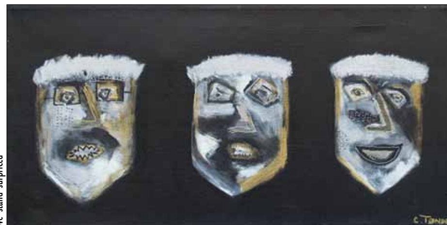
We stand suprised