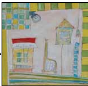
Er det bondegården?