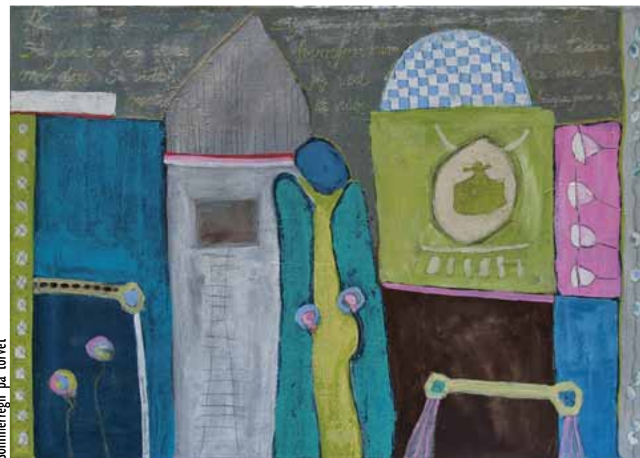
Sommerregn på torvet