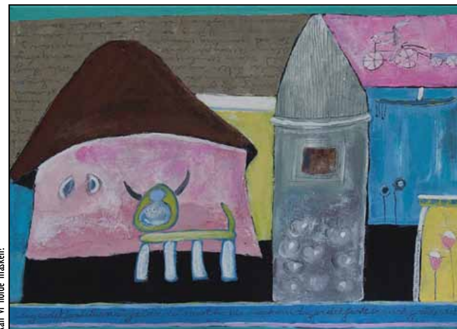
Kan vi holde masken?