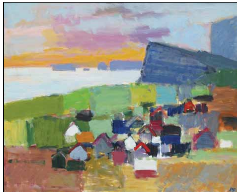
Altenlys på Færøerne

Det er ikke den vilde eksperimenteren man finder hos ham. Her har vi derimod med en kunstner at gøre, der grundigt har lært sig sin metier og, uden de store falbelader, ærligt skaber og udvikler billeder med rod i en lang (og stærk) tradition. Det er en tradition der absolut er langtidsholdbar, og er dukket frem hver gang nyhedens interesse og de store overskrifter fra de mere vilde eksperimenter har lagt sig. - Jeg tror altid der vil være en plads for den tekniske kunnen, den ærlige tilgang til kunsten og en holden fast ved rødderne - også selvom denne mere beskedne tilgang ikke skaber de store overskrifter.