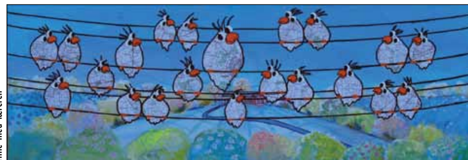
Time med læreren