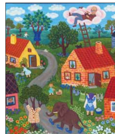
Yderst: Opfinder Olsen