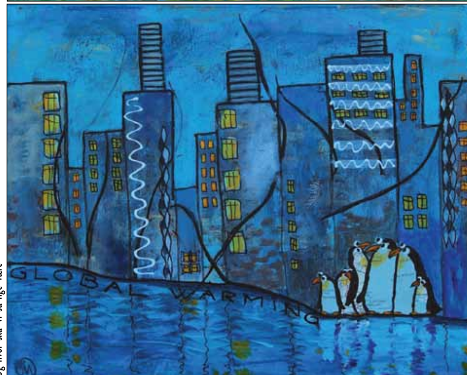
Og hvor ska vi så lige være