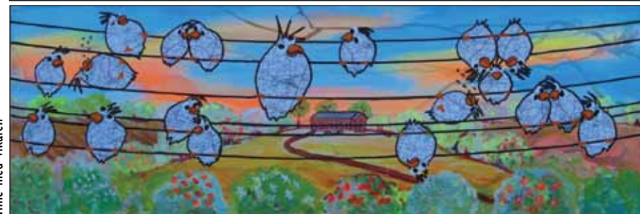
Time med vikaren