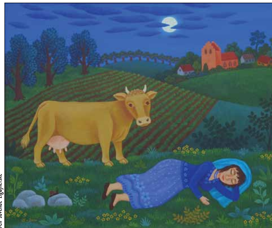
Den sovende zigøjnerske