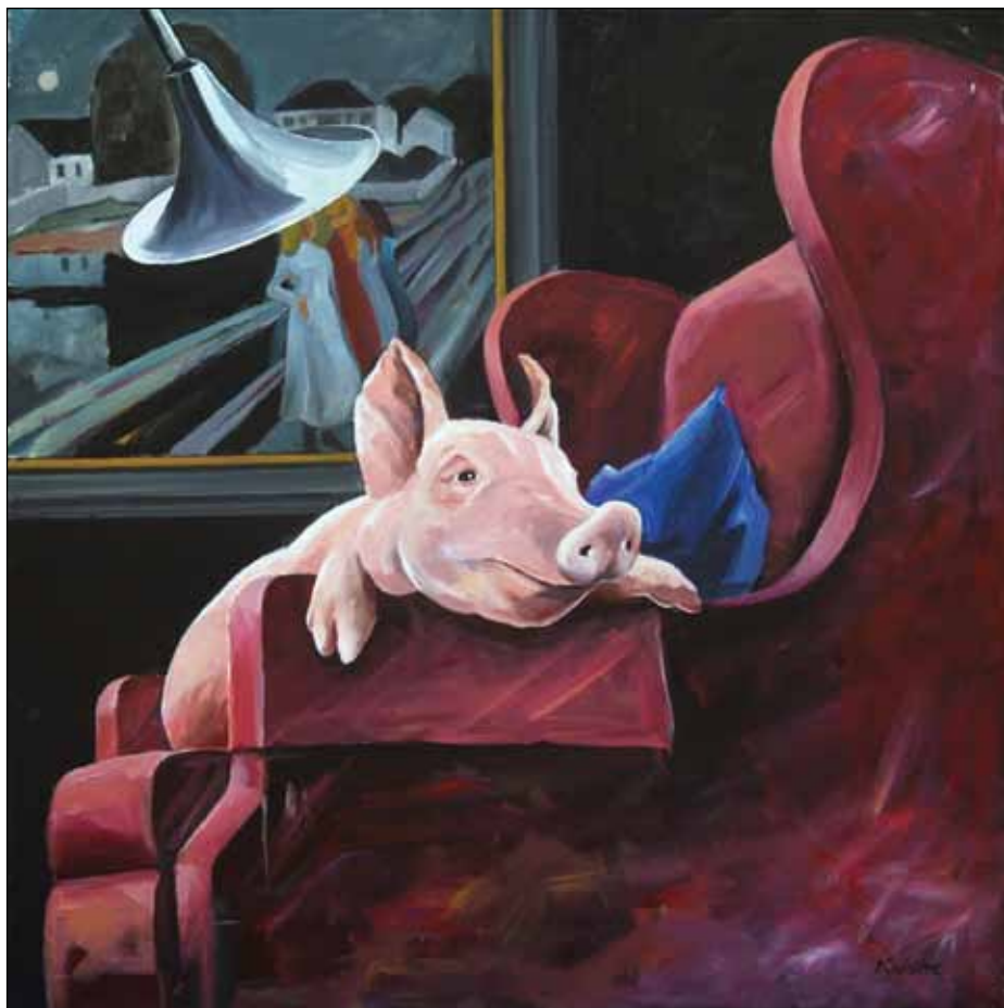
Gristen i stolen