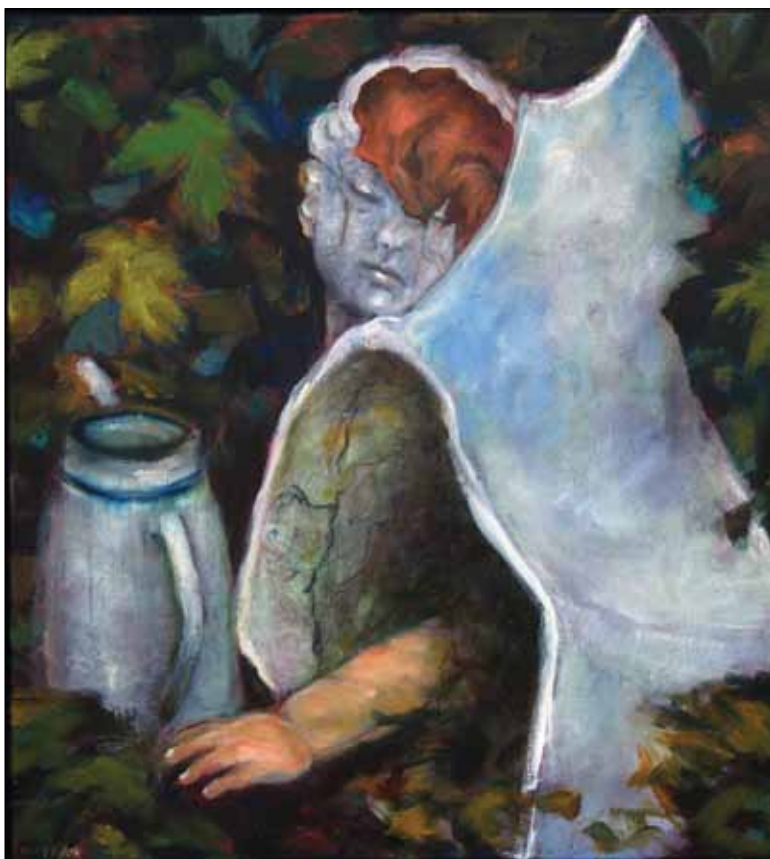
En hemmelig have