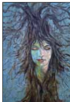
Så kom våren