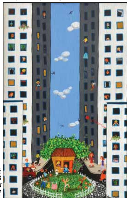
Isis de Siqueira: Oase