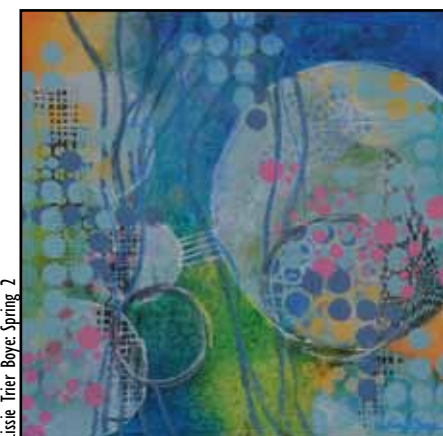
Lissie Trier Boye: Spring 2