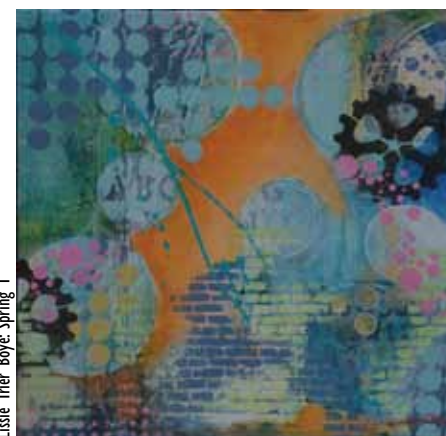
Lissie Trier Boye: Spring 1