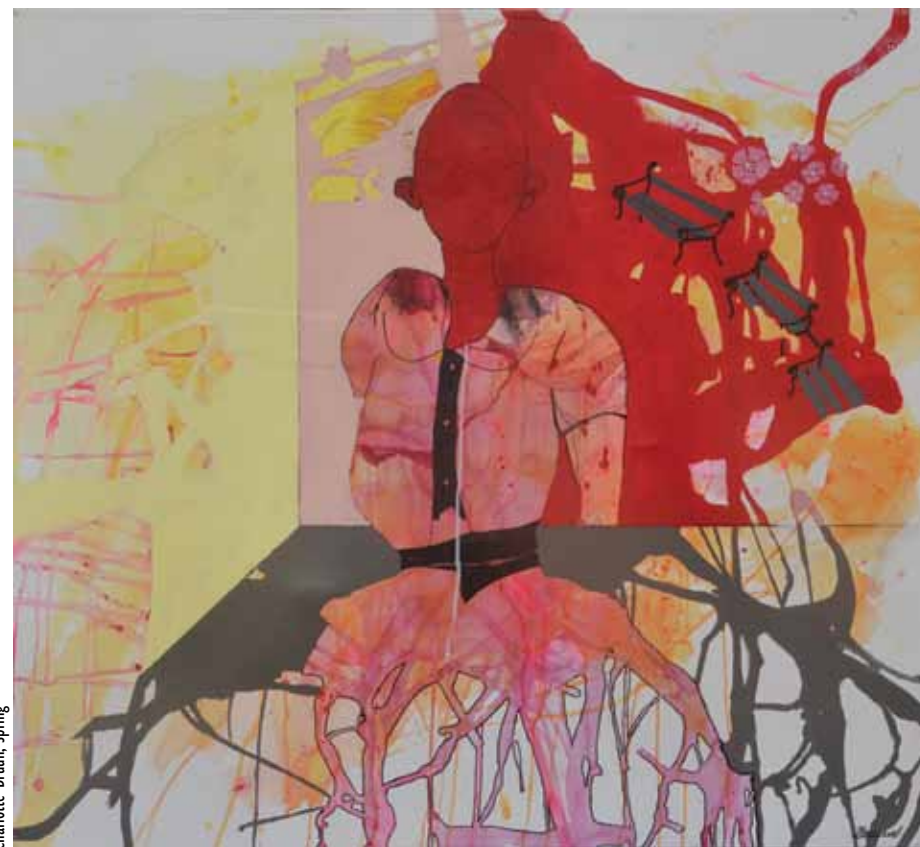
Charlotte Bruun, Spring