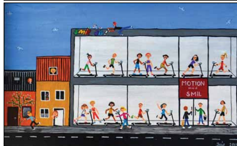
Isis de Siqueira: Smil så!