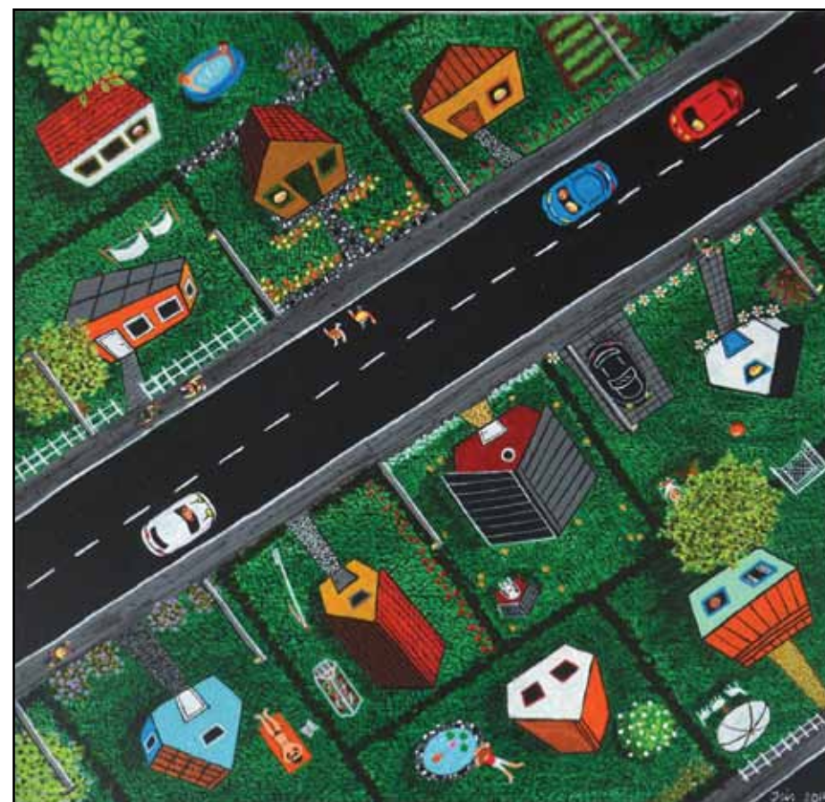
Isis de Siqueira: De velordnede