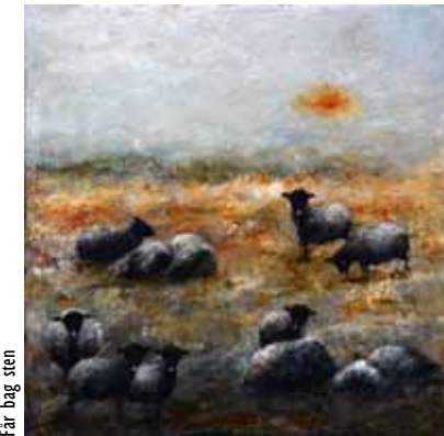
Får bag sten