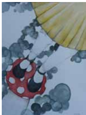
Jorden er giftig