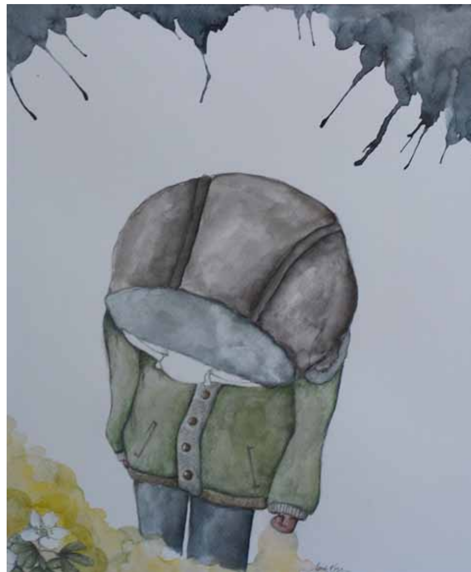
Du er den