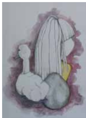
Søg og du skal finde