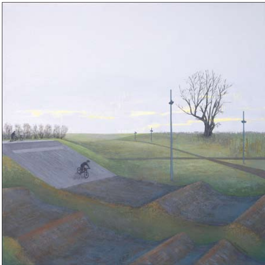
Børn- og ungeparken, 2008.

Kunsthistoriker mag.art. Gitte Tandrup siger: