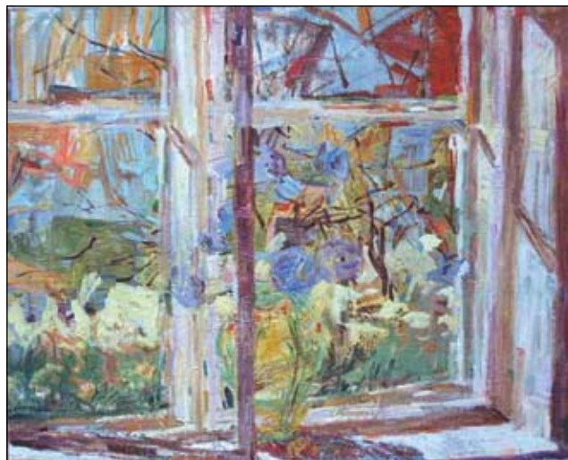
Vildt vindue, olie på lærred, 94 x 79 cm.