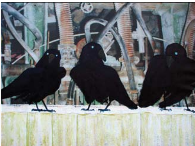
Vor der Produktionshalle, olie på tryk, 100 x 130 cm.

Medlem af: ProKK: Forening for professionelle kunstnere og kunsthåndværkere BKF