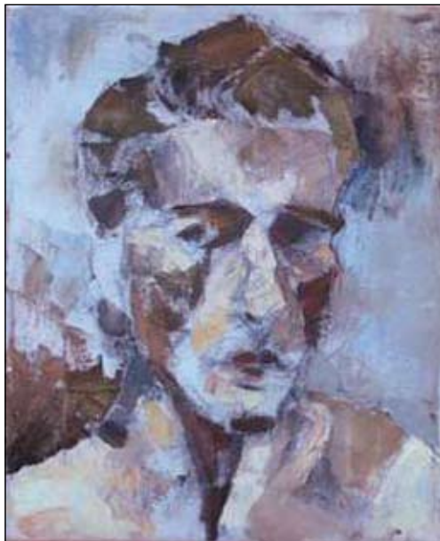
Mand model, olie på lærred, 27 x 33 cm. Privateje.