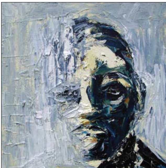
HALBEXX. Se også forsiden på årets Katalog.