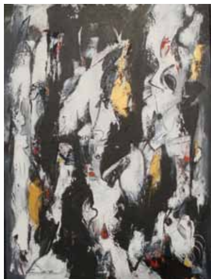
Vibe Milbak, maleri.