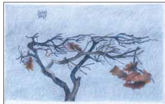
Birthe Rønsholt Jensen, syet billede