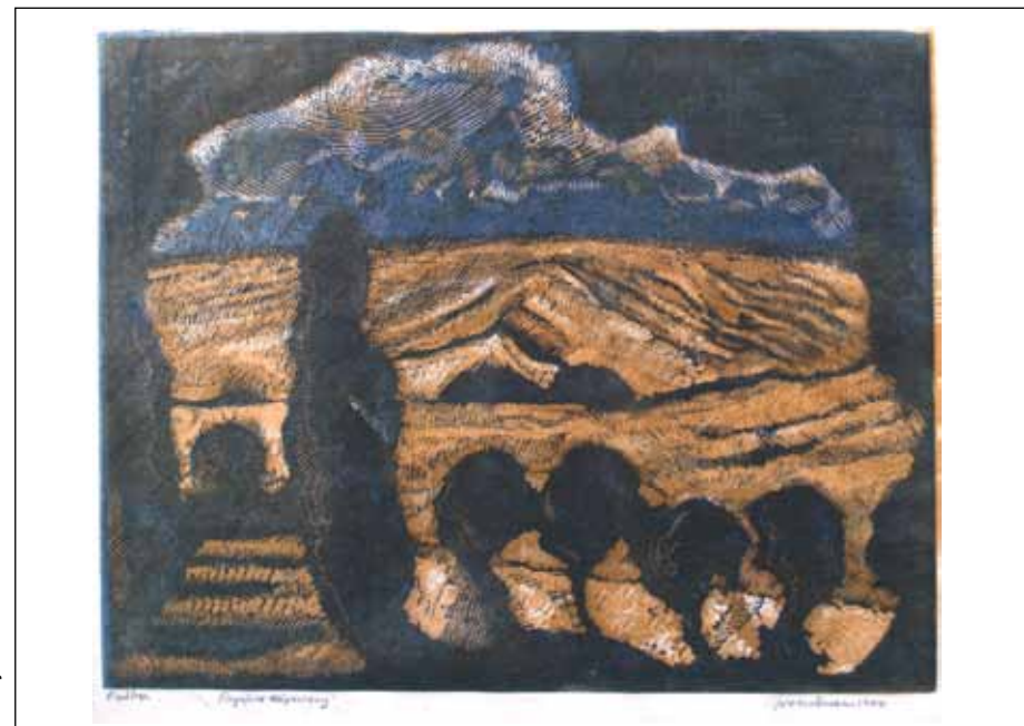
Groth Jensen, flerfarvelinoleumssnit