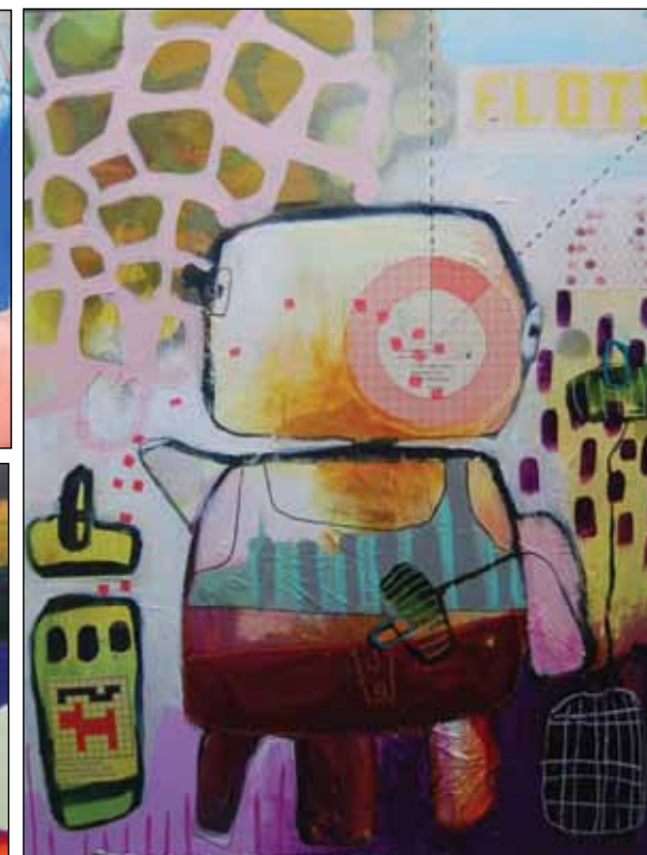
Øverst: Fragment 60x120 Til venstre midt: Uden titel 150x200 Herover: Uden Titel 60x80 Til venstre nederst: Uden Titel 80x120