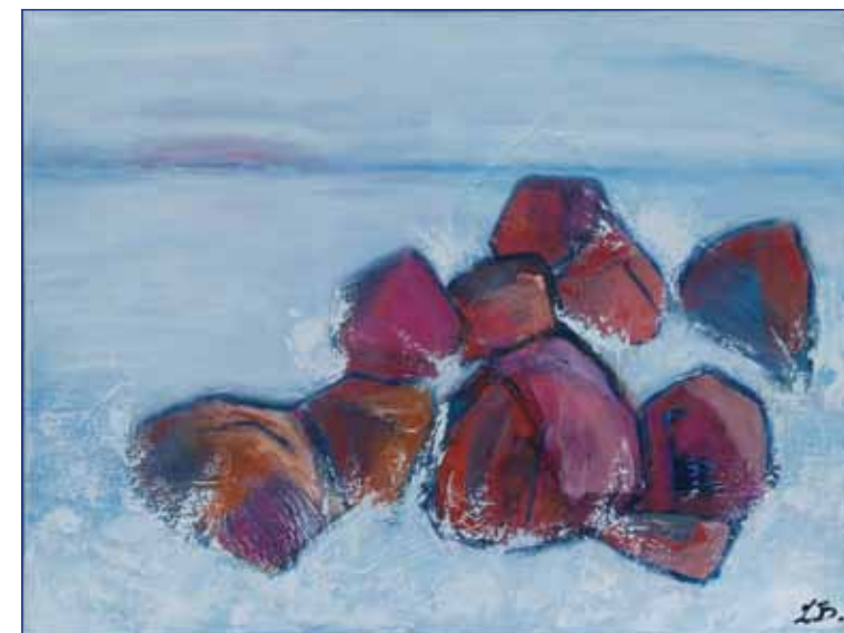
Pia Bolderslev, Havet 1