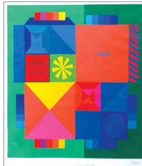
Karl Åge Riget - polycrom action