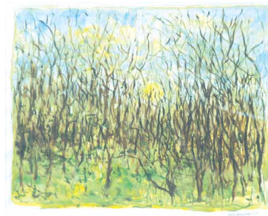
Erik Enevold: Fanø, akvarel.