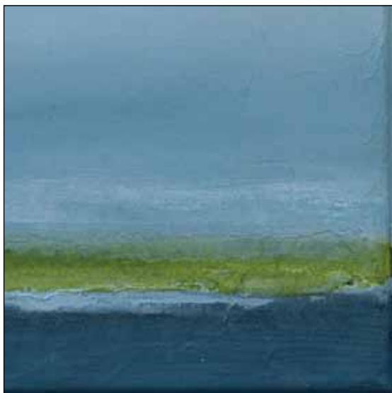
Dorthe Just Kristensen: Landskab