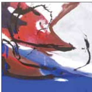
Som fisk i vandet

Alt hvad jeg laver bliver gennem processen til masker og mystiske væsner. Som en journalist på et tidspunkt skrev om mine små skulpturer og billeder: Det er dyr af forskellig art, som enten må være uddøde eller som vorherre måske ganske enkelt har glemt.