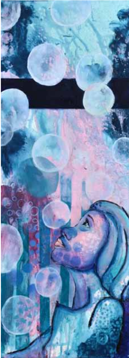
Fri af bobler

Det handler først og fremmest om mennesker. Selvfølgelig laver hun også landskabsbilleder, høns og meget andet, - og på mange måder... "Jeg vil ikke sættes i bås!..." siger hun. Men når man søger "den røde tråd" i hendes arbejde, så er det mennesker det handler om. - Og det er, efter min mening, også når det kommer til den direkte skildring af mennesket, hendes arbejder er stærkest. Også uanset hvilke tekniske udfordringer hun giver sig selv.