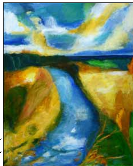
Erindringer langs åen