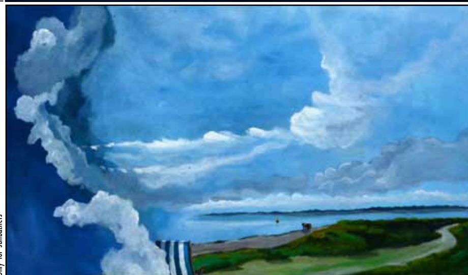
Only for sunbathers