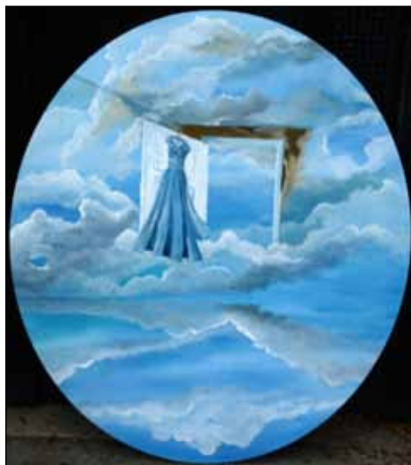
The light blue summerdream

Alt malet i en naturalistisk stil og maleteknik, som dels vidner om en rutineret kunstner, som til fulde magter sin tegne- og maleteknik. Og dels fortæller om kendskabet til- og forståelse for de traditionelle teknikker.