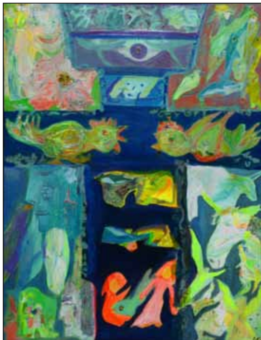
Hop i mand