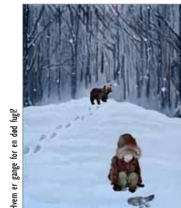
Hvem er gange for en død fugl?