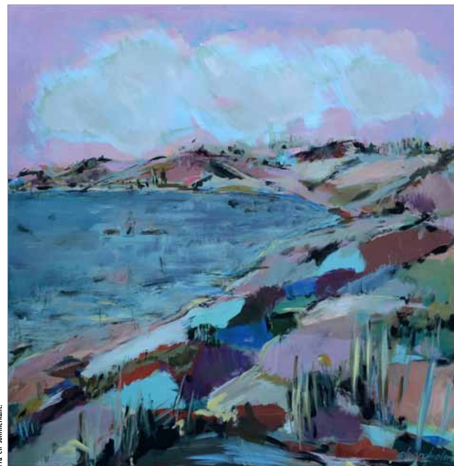
Fra en sommerkant.

Menneskeskildringerne har hun hovedsageligt hentet fra sine rejser – dem vi har lånt, er fra Middelhavsområdet, hvor hun har iagttaget sine medturister, når de iagttog de seværdigheder, der som regel ikke har fået plads i billedet – når lige undtages én, som ser på billeder, og hvor hun har lavet det lille drilske fif, at lade de billeder der bliver iagttaget være hendes egne. Men rejser man ud på nettet, møder man en masse