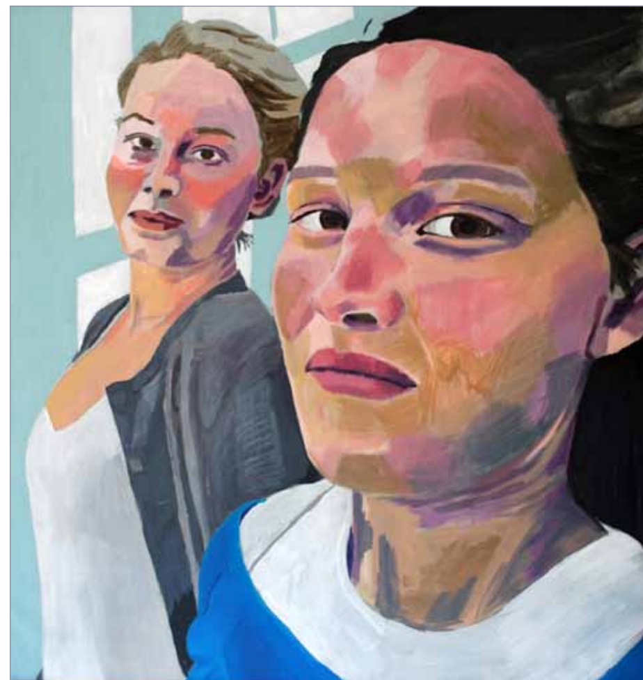
Lodret og vandret II