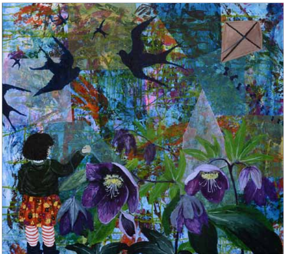
Forår i haven.

Historierne er eventyragtige og drømmene, med umage venskaber mellem børnene og bjørne, isbjørne, svaler og harer. Når undtages billedet om foråret