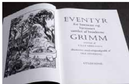
Ole Sparring har bl.a. illustreret Gyldendals udgivelse af Grimms eventyr

Fra tid til anden medfører det, at bestyrelsen må afsætte tid til at rydde op i depotet, og det er ikke en lille opgave. Men først og fremmest er det en opgave, som også medfører noget