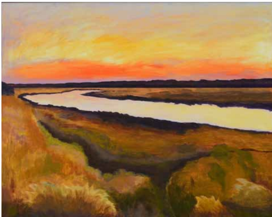
Solnedgang over engen