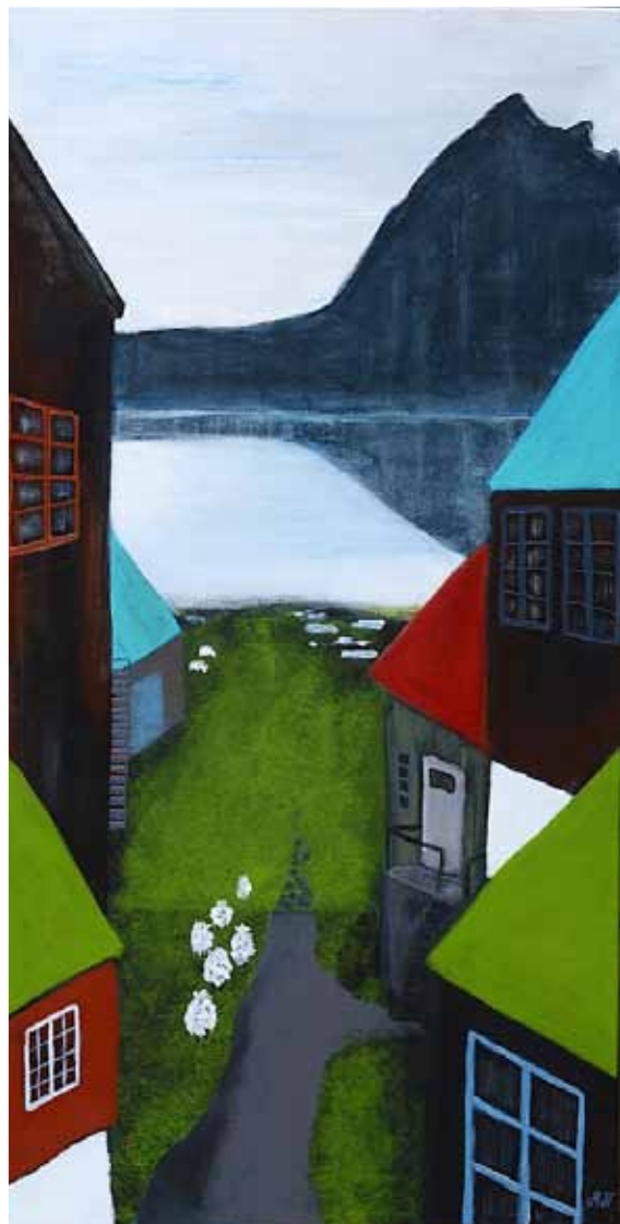
Gjógv - stræde