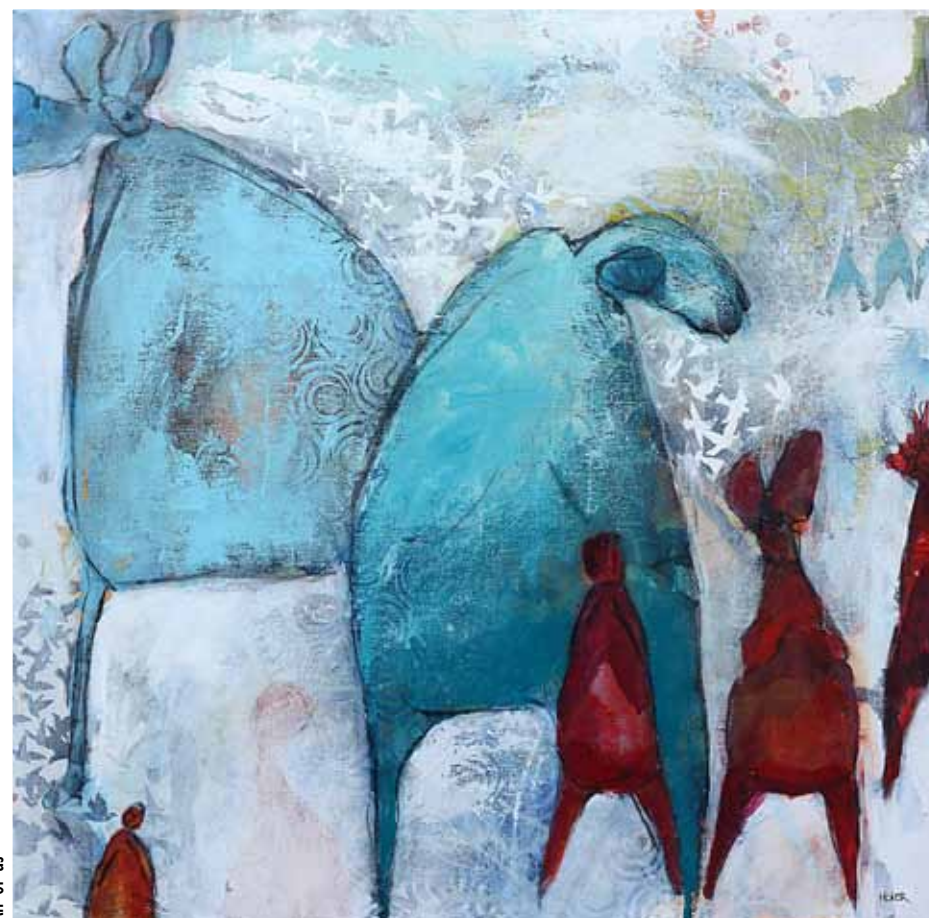
All of us

Billedernes baggrund er om muligt endnu mere unaturalistiske. Som regel er den ret lys, og er bearbejdet med alle akrylmalingens muligheder: collage-elementer, lag på lagmaling, shumring, maling på specielle strukturer, så der dukker vekendte elementer frem ud af malebunden. Det er tydeligt at hun godt kan lide at eksperimentere med alle mulige teknikker (og at hun også behersker dem.)