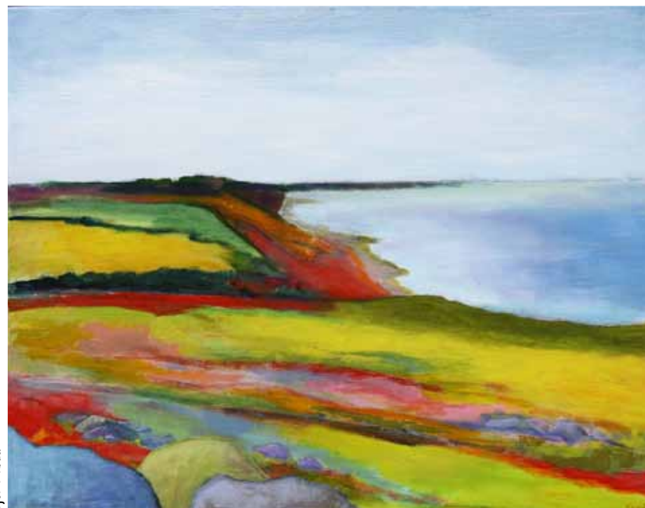
Fjor i rødt.