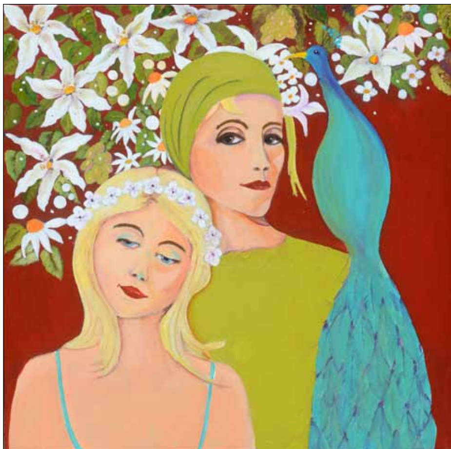
Mor og datter.

Set ud fra de billeder vi har lånt af Birthe Spiertz, kunne man godt tro, vi har lånt af to helt forskellige malere. Der er portrætbilleder af kvinder, malet i klare næsten flade flader, enten næsten rent ensfarvede eller dækket af et mønster. Dertil tilføjet et dekorativt blomsterflor tilsat stiliserede påfugle. Alt i alt malet som dekorativt flademaleri, selv om hun også er lykkedes med, at give kvinderne en tydelig personlighed.