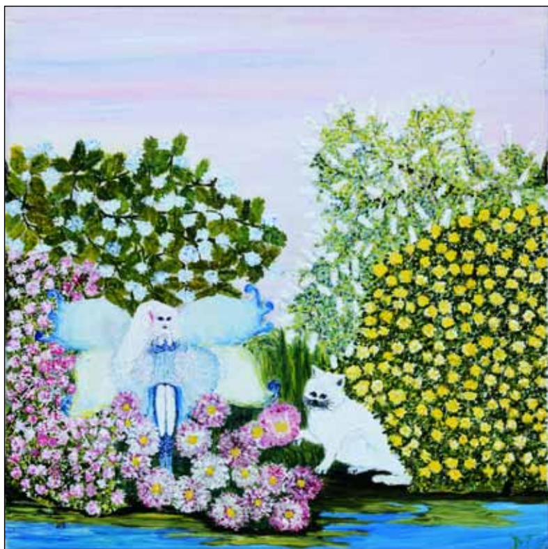
The fairy and the cat