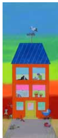
Arrival of the stork 2 1